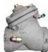
VALVOLA PNEUMATICA INGRESSO ARIA NC