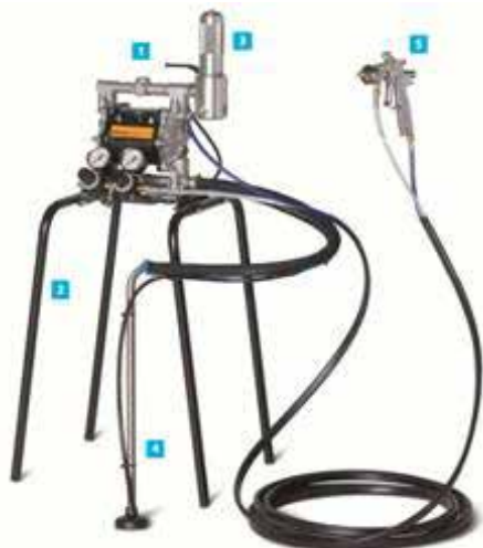
POMPA A MEMBRANA a bassa pressione