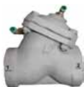
VALVOLA PNEUMATICA INGRESSO/SCARICO ARIA NA