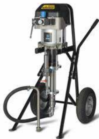
POMPA A PISTONE ad alta pressione