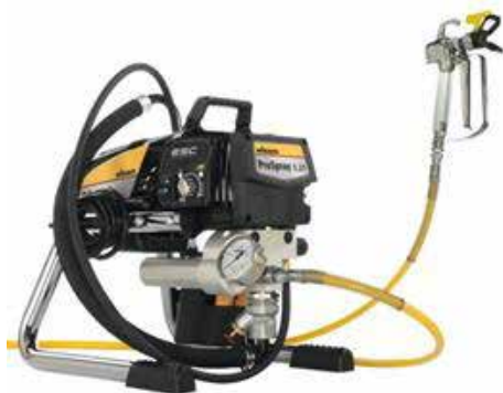
POMPA ELETTRICA A PISTONE per edilizia